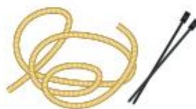
Touw of tie-wraps

Kort gesneden riet of gras kunt u bij voorkeur uit de buurt halen waar u het nest plaatst. Zo brengt u geen vreemde geuren in de korf.