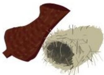
Broedkorf of hooirol